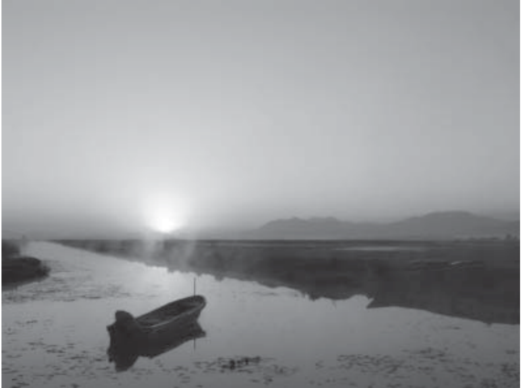
Canal de Erongarícuaro