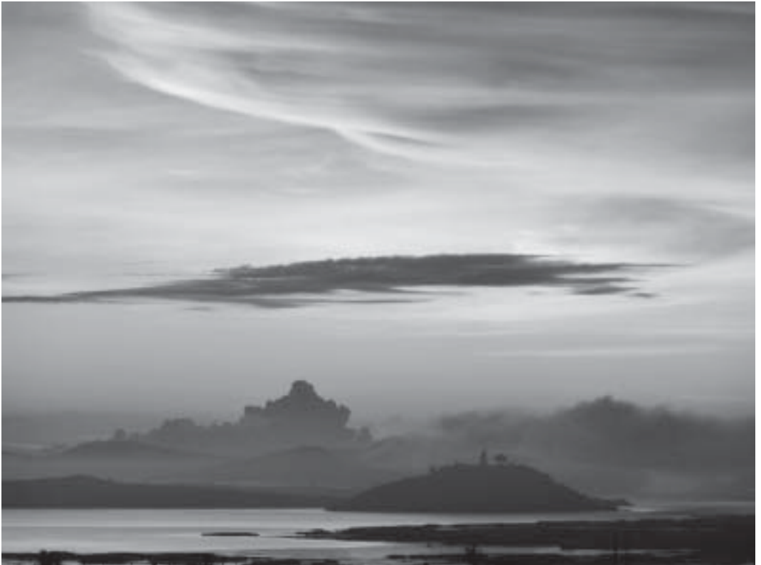
Janitzio al amanecer